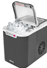
Ice Cube Maker CR 8073