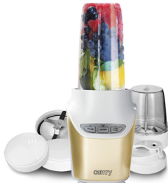
Personal Blender CR 4071