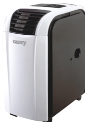
Air conditioner CR 7902