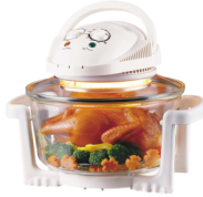
Halogen Oven CR 6305