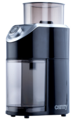
Burr Coffe Grinder CR 4439