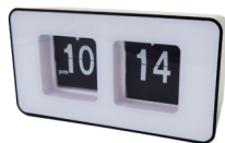
Auto-flip clock CR 1131