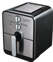
Air fryer CR 6306