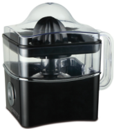
Citrus juicer CR 4001