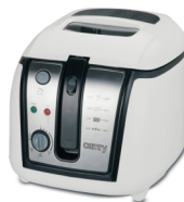
Deep fryer CR 4907