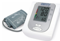
Arm blood pressure monitor CR 8409