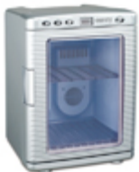
Mini-fridge CR 8062