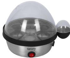
Egg Boiler CR 4482