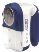
Lint remover CR 9606