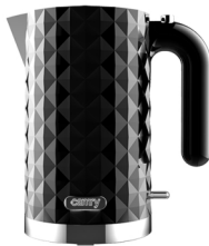
Electric Kettle CR 1269