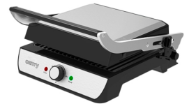
Electric Grill CR 6609