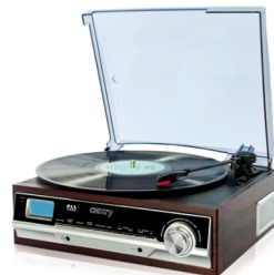
Turntable with radio CR 1113