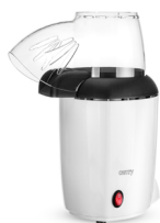
Popcorn maker CR 4458