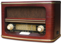
Retro Radio CR 1103