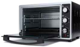
Electric Oven CR 6018