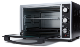
Electric Oven CR 6018