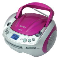
CD/MP3 player (boombox) CR 1123