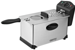
Deep Fryer CR 4909