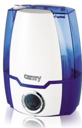
Air humidifier CR 7952