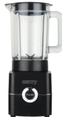
Blender CR 4050