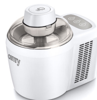
Ice Cream Maker CR 4481