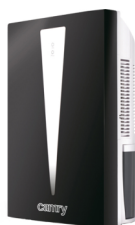
Air dehumidifier CR 7903