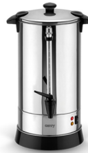
Electric Boiler CR 1267