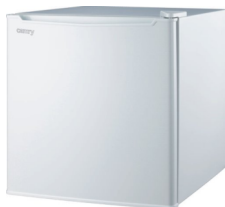
Aggregate refrigerator CR 8064