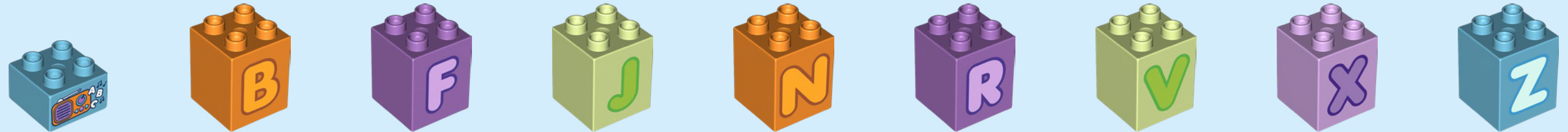
1x 6463132 1x 6286305 1x 6286310 1x 6286316 1x 6286321 1x 6286330 1x 6286334 1x 6286336 1x 6286337