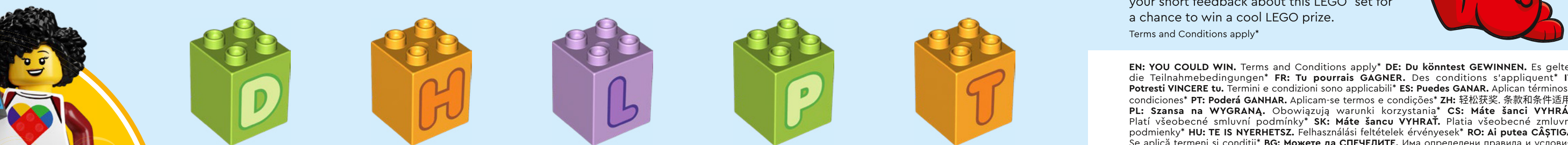
1x 6286307 1x 6286312 1x 6286319 1x 6286327 1x 6286332